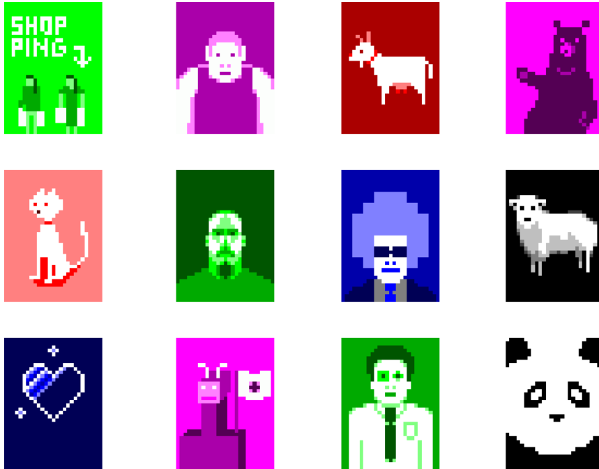
「12Pixels」を利用したピクセルアート(イメージ)

携帯電話で簡単なピクセルアートを作成。オリジナル絵文字にして作成・送信も可能 「12Pixels(トゥエルブ・ピクセルズ)」無償ダウンロード開始